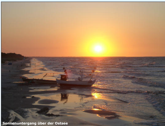
Sonnenuntergang über der Ostsee