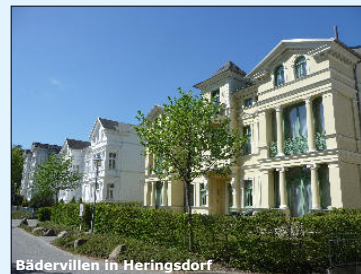
Bädervillen in Heringsdorf

Sehenswert sind daneben viele Dorfkirchen, etwas abgelegene Fischerdörfer und natürlich die wilhelminische Bäderarchitektur in den Kaiserbädern Bansin, Heringsdorf und Ahlbeck mit der nahezu 8 Kilometer langen, durchgehenden Strandpromenade und ihren unzähligen wunderschön restaurierten Bädervillen.