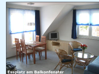
Essplatz am Balkonfenster

Unmittelbar an Wald und Wiesen befinden sich die komfortablen und behaglichen Steinbock Ferienwohnungen im Seebad Kölpinsee/Loddin. Alle unsere Ferienwohnungen sind sonnig und modern, verfügen über ein geräumiges Wohnzimmer mit hochwertiger