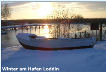
Winter am Hafen Loddin

Ferienwohnungen bilden zu jeder Jahreszeit einen komfortablen und gemütlichen Ausgangspunkt für viele phantastische Ausflüge.