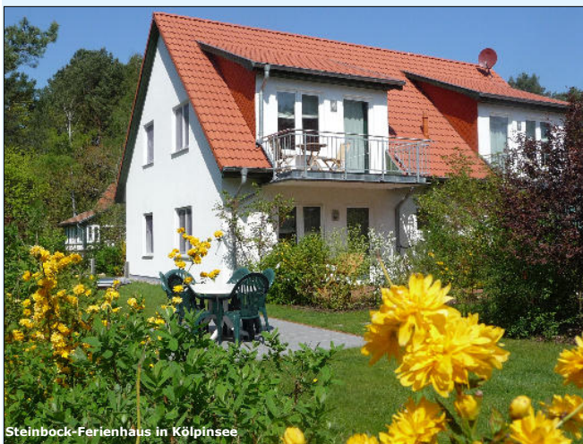
Steinbock-Ferienhaus in Kölpinsee