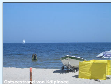
Ostseestrand von Kölpinsee

Bereits fußläufig erschließt sich eine der schönsten Landschaften der Insel. Im Norden bilden Ostseestrand, Deich und der Kölpinsee ein traumhaftes Panorama. Im Süden ragt die Halbinsel Loddiner Höft mit einer malerischen Steilküste in das Achterwasser.