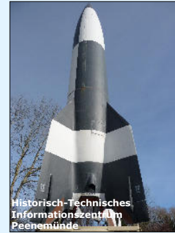
Historisch-Technisches Informationszentrum in Peenemünde

Usedom verfügt über ein reiches kulturelles Leben. Neben verschiedenen Theatern und Museen sind das Usedomer Musikfestival und