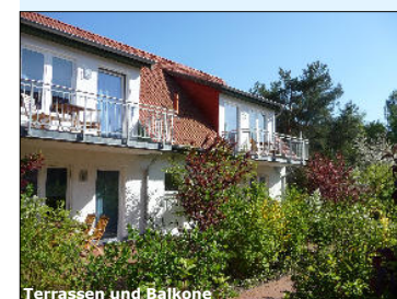
Terrassen und Balkone

Unsere Erdgeschosswohnungen sind vollständig seniorengerecht,