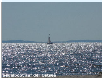
Segelboot auf der Ostsee

In der Mitte von Usedom, wo Ostsee- und Achterwasserküsten einander am nächsten sind, befindet sich das Seebad Loddin. Obwohl für alle Ausflüge auf der Insel zentral gelegen, ist das Seebad eines der kleineren und ruhigen Bäderorte.