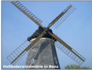
Holländerwindmühle in Benz

Schon früh besiedelt und einem häufigen Wechsel der Herrscher unterworfen, entwickelte sich eine wechselvolle Geschichte, vor allem bestimmt von Fischerei und Seehandel. Neben steinzeitlichen