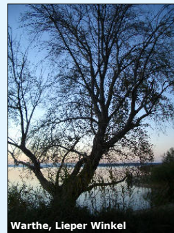
Warthe, Lieper Winkel

Die Ostseeinsel Usedom im äußersten Nordosten ist nicht nur die zweitgrößte Insel sondern auch die sonnenreichste Region Deutschlands. Ein über 40 km langer steinfreier Sandstrand, die mehr als 150 km lange, gewundene Haffküste, viele Seen und Halbinseln und eine reiche Kulturlandschaft machen die Insel Usedom zu einem Erlebnis – und dies zu jeder Jahreszeit.