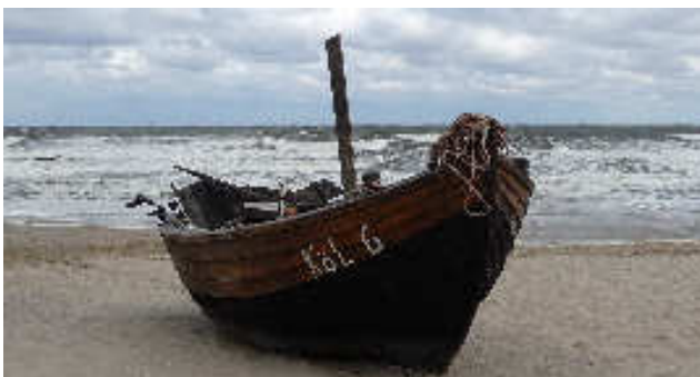
Fischerboot am Strand von Kölpinsee