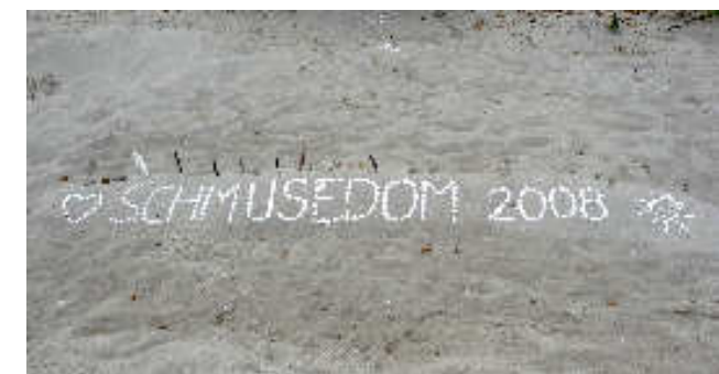
Inschrift im Strandsand bei Ückeritz