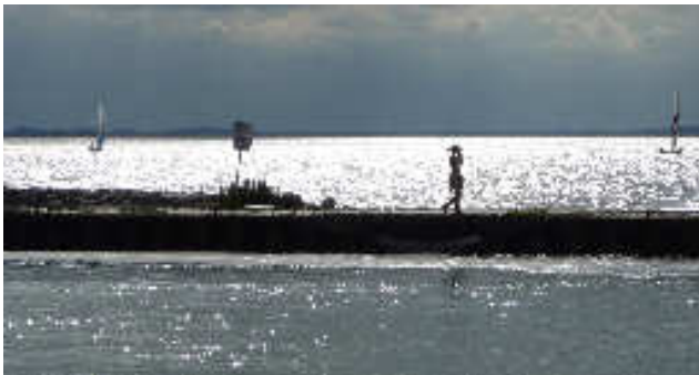
Achterwasserhafen von Ückeritz in der Abendsonne